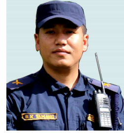
०७६ पुस ७ मा सरुवा भएर आफ्नो कार्यक्षेत्रमा रहेका थिए ।

१ वर्षमा नियमित सरुवा गर्नुपर्ने भएपनि प्रहरी प्रधान कार्यालयले पछिल्लो चार महिनावेखि सरुवा गर्न सकेको थिएन । सरुवा भएका प्रहरी निरीक्षकहरू